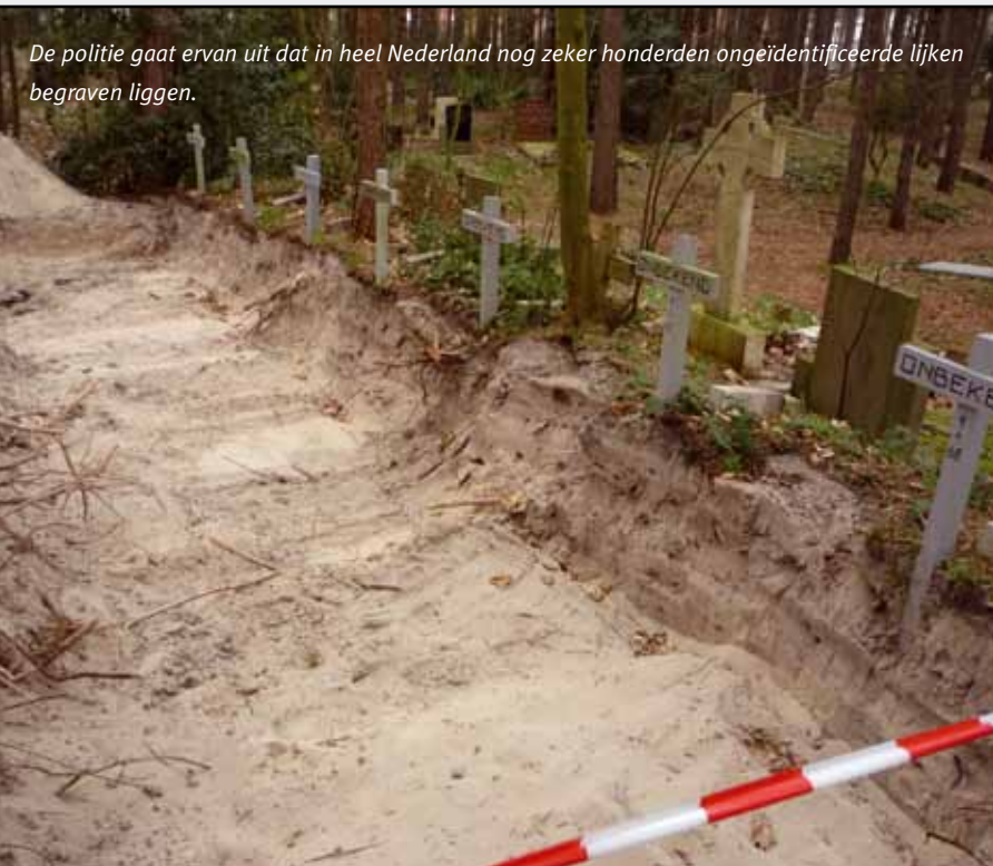
De politie gaat ervan uit dat in heel Nederland nog zeker honderden ongeïdentificeerde lijken begraven liggen.