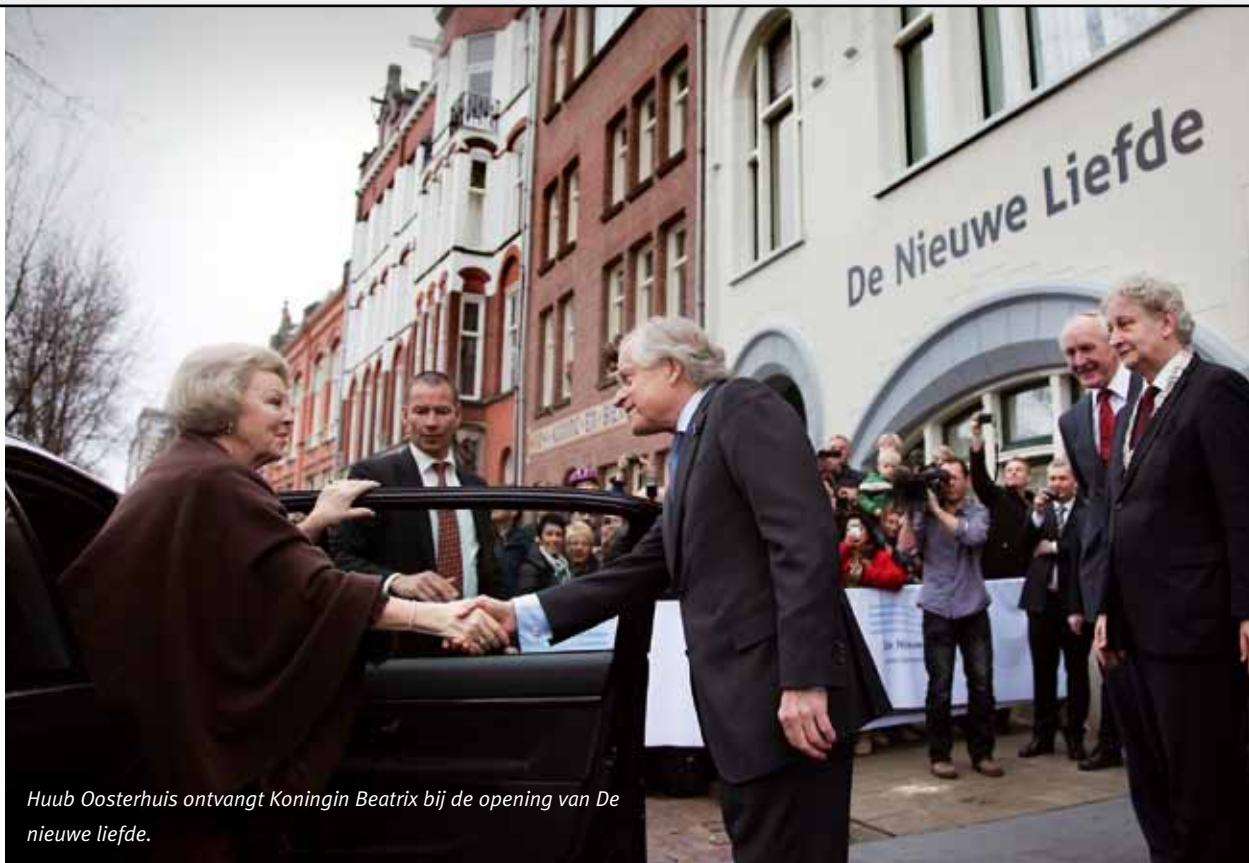
Huub Oosterhuis ontvangt Koningin Beatrix bij de opening van De nieuwe liefde.

In het Amsterdams cultureel centrum De Nieuwe Liefde staat een denktank op stapel onder de naam 'Burgemeester & Polariseratie'. Donderdag 2 februari 2012 reflecteert een tiental vakgenoten op de impact die de maatschappelijke polariseratie – denken in wij-zij tegenstellingen – heeft op het vak van burgemeester. Wie kan het spanningsveld omschrijven waar de burgemeester in verkeert? Wie weet te binden, zonder verschillen te verbloemen?