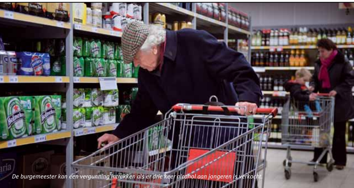
De burgemeester kan een vergunning intrekken als er drie keer alcohol aan jongeren is verkocht.

sche dranken verkopen aan jongeren onder de zestien jaar. De burgemeester kan in zo'n situatie de ondernemer de bevoegdheid ontzeggen zwak-alcoholhoudende drank te verkopen vanaf de locatie waar bedoeld gedrag heeft plaatsgevonden. Ook dit vraagt om aanpassing van het handhavingsbeleid.