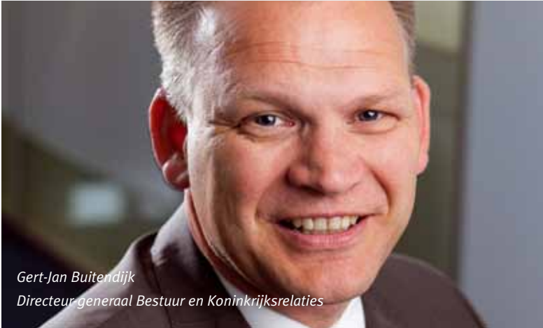
Gert-Jan Buitendijk Directeur-generaal Bestuur en Koninkrijksrelaties

In de zomer zijn twee onderzoeken gepubliceerd naar de positie van politieke ambt dragers op het lokale niveau namelijk De vallende wethouder en Bestuurders onder druk . Aanleiding voor beide onderzoeken was het toenemend aantal voortijdig en onvrijwillig terugtrekkende wethouders gedurende de laatste bestuursperiodes. Bedroeg het percentage 20 procent in de periode 1990-1994, in de periode 2006-2010 was het percentage opgelopen tot 30 procent.